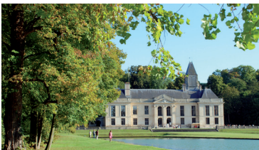
Parc du Château de Méry-sur-Oise

PARC ET CHÂTEAU DE MÉRY-SUR-OISE 3 avenue Marcel Perrin www.merysuroise.fr Atelier « Peindre dans ma ville » dim 8h30-17h (rés. 01.30.36.23.00). Anim. « Petite pêche dans la mare » dim 14h-18h. Activités écologiques dim 14h-17h. Atelier jardinage « Monsieur Patate » dim 14h-18h. Spect. « Jardins d'enfants » dim 15h15 et 16h30.