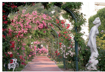
La Roseraie du Jardin des Plantes

JARDIN DES PLANTES Allée Cuvier / 01 40 79 54 79 jardinsdesplantes.net - www.mnhn.fr Conseils de jardiniers sam-dim 10h-17h. Expo. sam 14h-17h / dim 11h-17h. Parcours sensoriel sam 14h30-16h, dim 11h, 14h et 16h. VG : «Les arbres remarquables du Jardin des Plantes» sam-dim 11h30, 14h30 et 16h. VG «Le laboratoire de culture in vitro» sam-dim 11h, 14h et 15h30. VG «Des plantes et des hommes» sam-dim 11h 14h et 16h. VG «Ecologie et botanique» sam 14h-16h, dim 11h, 14h et 16h. VG «La palette du jardinier» sam-dim 11h15, 14h15 et 16h15. VG «Le jardin alpin» ven-dim 15h. Parcours enfant sam 14h30, 16h30 / dim 10h30, 14h30 et 16h30. Atelier ven 10h, 13h30 et 15h.