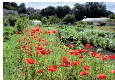
Jardin de l'Hermitage Pontoise

JARDIN DU MUSÉE DE L'OUIL Rue de la Mairie / 01 34 67 00 91 musee.guiry@valdoise.fr - www.valdoise.fr Spect. danse ven 14h30 / sam-dim 16h.