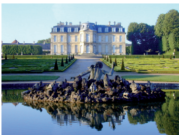
Le bassin de Scylla au château de Champs-sur-Marne

MUSÉE DÉPARTEMENTAL STÉPHANE MALLARMÉ 4 promenade Stéphane Mallarmé 01 64 23 73 27 mallarme@cg77.fr / www.seine-et-marne.fr VL sam-dim 10h-12h30, 14h-17h30 Atelier (8-9 ans) (rés.) sam 14h30. Atelier (7-10 ans) (rés.) dim 15h.