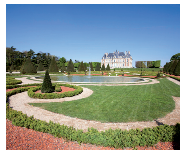
Les jardins de Malmaison au printemps