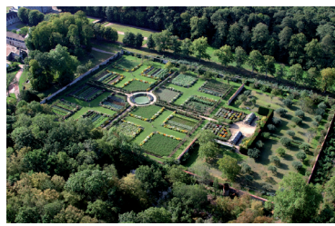
Vue aérienne du potager fleuri de Saint-Jean de Beauregard