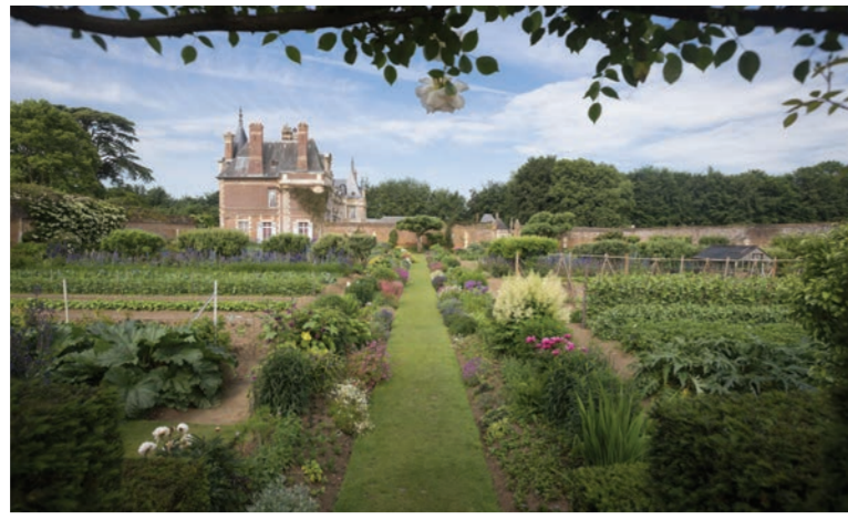
44 Jardin potager du château de Miromesnil