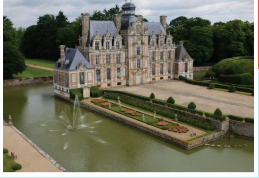
2 Parc du château de Beaumesnil

Dix-sept jardins de Haute-Normandie bénéficient du label jardin remarquable. Celui-ci, créé par le ministère de la Culture et de la Communication en 2004, est destiné à reconnaître l'intérêt historique et botanique et la qualité d'entretien de parcs et jardins ouverts à la visite. La protection au titre des monuments historiques prend en considération le monument mais aussi ses abords et l'environnement dans lequel il s'inscrit. Le monument est protégé du fait de son intérêt historique, artistique ou architectural. Deux niveaux de protection existent : un monument peut être classé ou inscrit comme tel, le classement étant le plus haut niveau de protection.