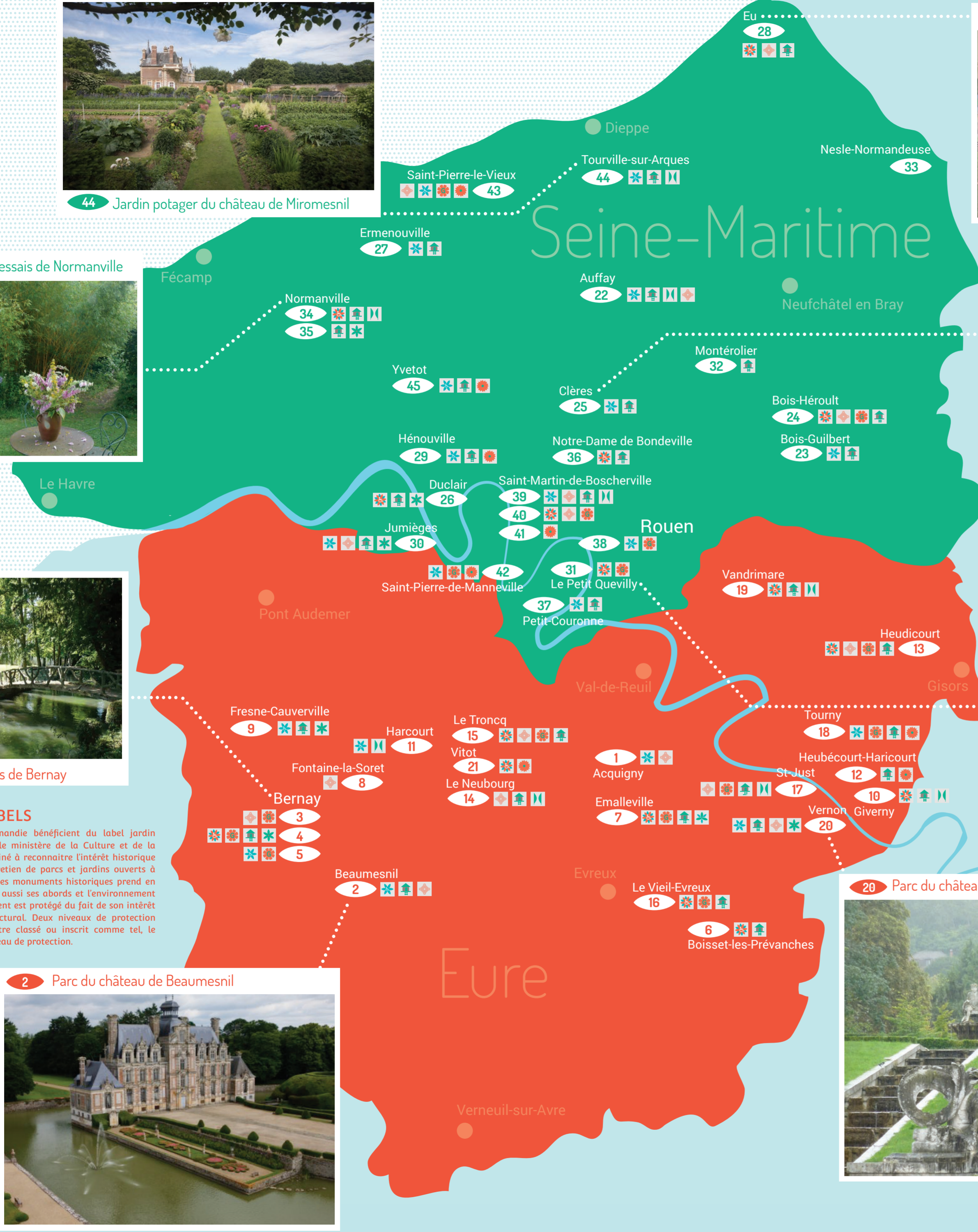
28 Parc et jardin du château d'Eu