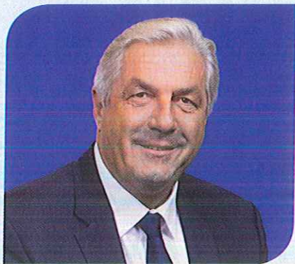
François SAUVADET Candidat à la présidence de la Région Bourgogne Franche-Comté Tête de liste de la Côte-d'Or