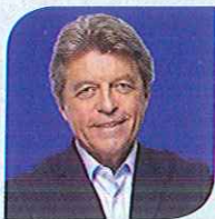
Alain JOYANDET Tête de liste de la Haute-Saône